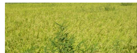
クサネムが繁茂した圃場