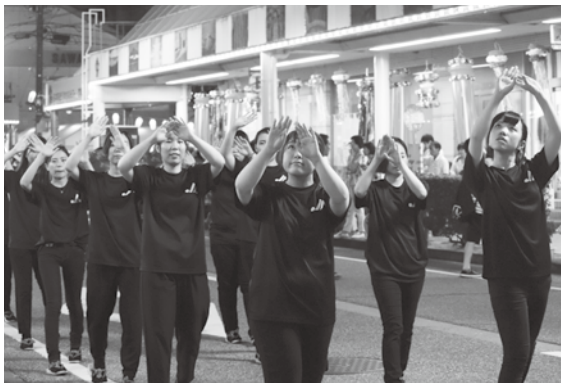
上市まつりに参加した職員たち

会場には特設ステージが設けられ、イベントが行われるなど会場は大賑わいを見せていました。JAアルプスから25名の職員が参加し、毎年恒例の「JAアルプス祭りTシャツ」を着て上市音頭を踊り、見事「町流しパフォーマンス賞」に輝きました。