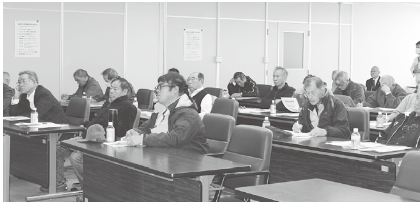
説明会に参加した生産者たち