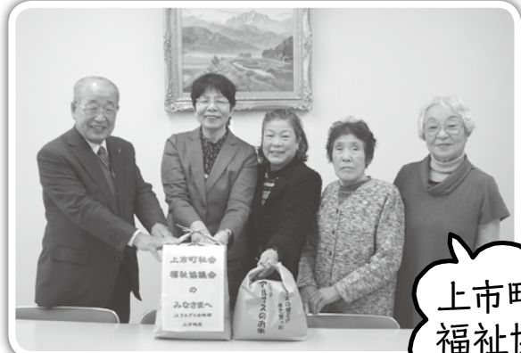
上市町社会福祉協議会

J A女性部員から集めた新米15kgを上市町社会福祉協議会へ寄贈しました。また、相ノ木・南加積地区の一人暮らしの方のご自宅にお米5合を届け、大変喜ばれました。