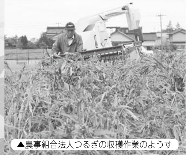
▲農事組合法人つるぎの収穫作業のようす