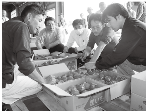
目揃い会のようす