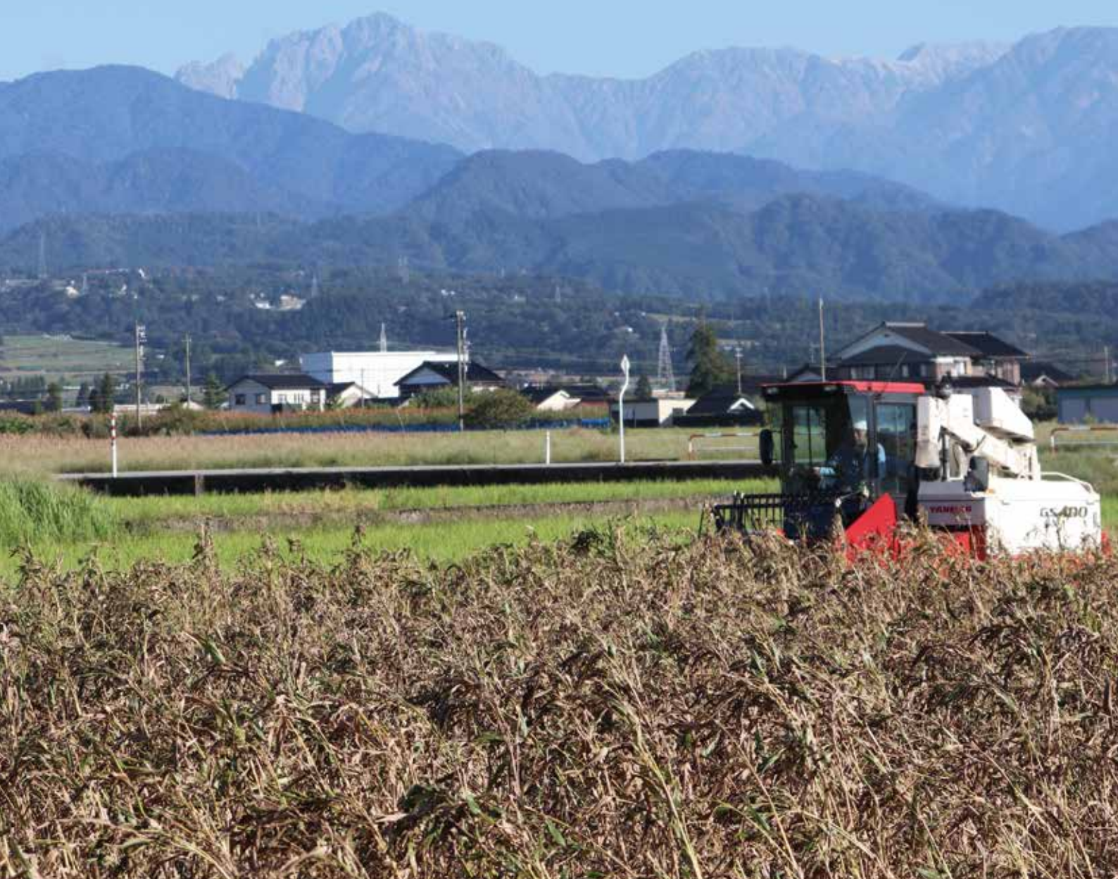
ハトムギ収穫のようす (野町農事組合法人)