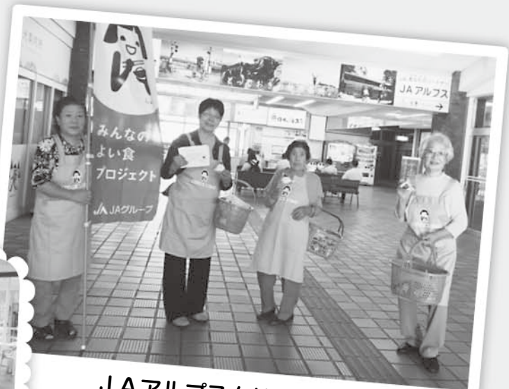
JAアルプス女性部の皆さん