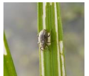
イネミズゾウムシ(成虫)と食害あと