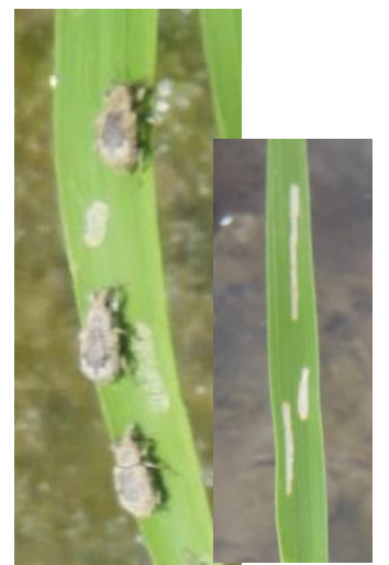
イネミズゾウムシと食痕