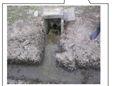
写真2 溝と排水口の溝の連結