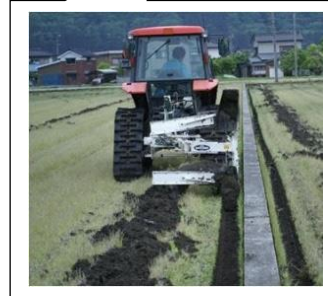
写真1 額縁排水溝の設置