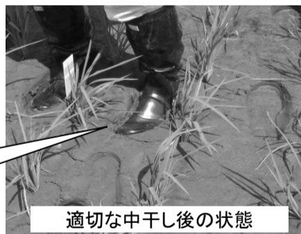
適切な中干し後の状態

中干し終了の目安は、圃場中央部でくぼみが軽く沈む程度（足跡深さ3cm程度）を目安とします。