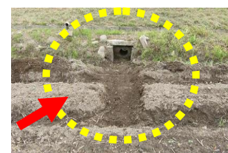
排水溝を連結し、水尻へつなげる