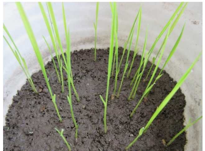
④種まき 14 日後 (植えてみよう !!)