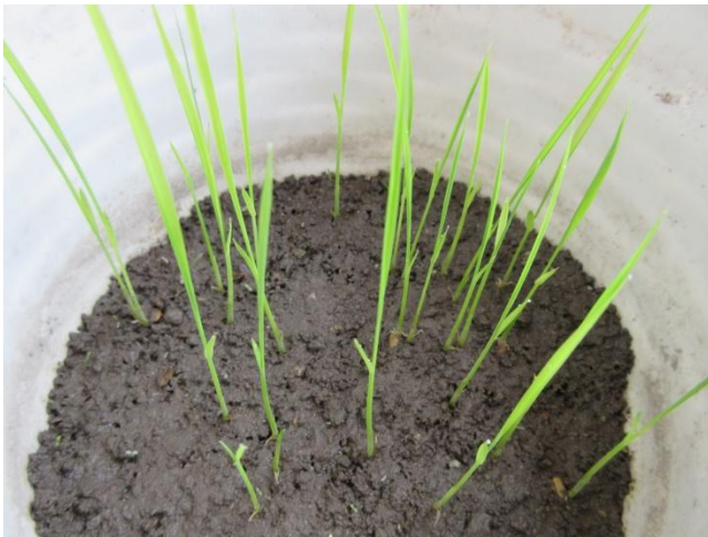
③ 種まき 13 日後 (かなり伸びてきた)