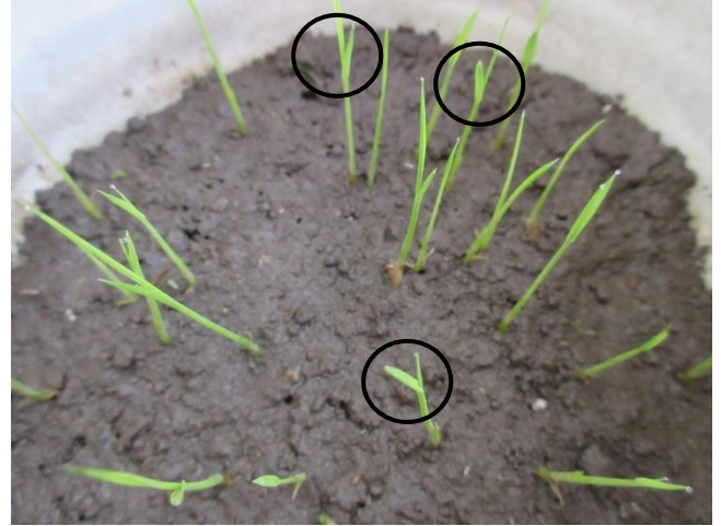
②種まき 10 日後 (葉が出る)