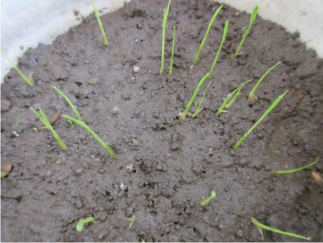
① 種まき 8 日後