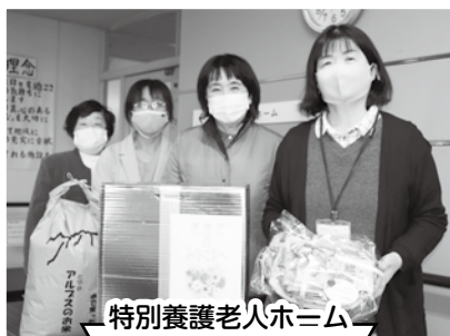
特別養護老人ホーム 清寿荘

JA女性部滑川地区は12月3日、同市の特別養護老人ホーム清寿荘と特別養護老人ホームカモメ荘、老人保健施設なごみ苑の3カ所に、新米10kg・加積リンゴ1箱・手作りマスクを寄贈しました。