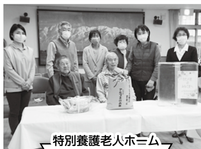
特別養護老人ホーム カモメ荘