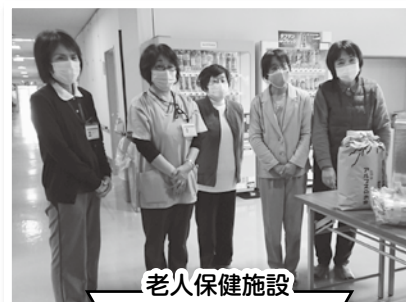
老人保健施設 なごみ苑