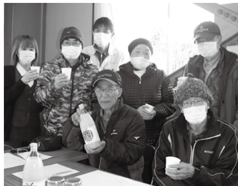
上市町果樹協会のみなさん

上市産りんごジュース(1本 1,000ml 600円税込)と、りんごジャム(1個 180g 450円税込)は、JAアルプス上市営農経済センター(配送班)や地元の農産物直売所などで購入できます。