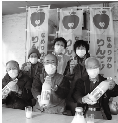
滑川市りんご組合のみなさん

応に苦労したが、美味しいりんごが収穫でき昨年よりもたくさんジュースを加工できて安堵している。近年の気候変動に対応し、適期作業を徹底して、今後も美味しいりんごの生産に努める。」と話しました。 ジュースは、JAアルプス滑川営農経済センター(配送班)のほか、滑川市内の一部スーパーや各生産者の自宅の直売所などで購入できます。