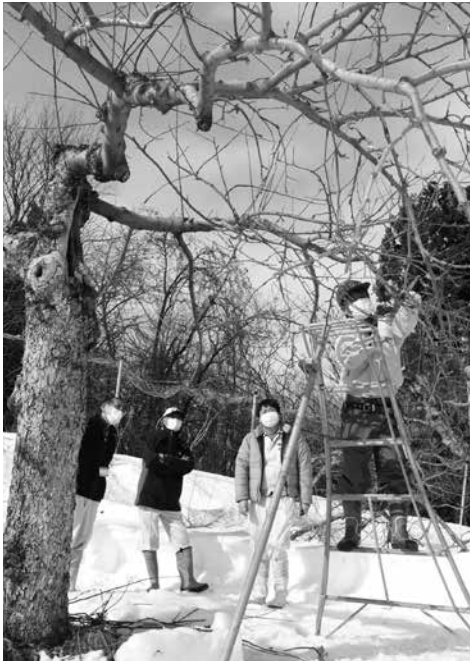
剪定作業講習の実演のようす