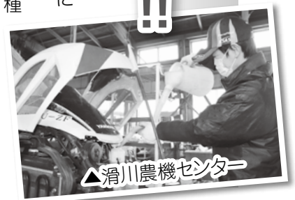
▲滑川農機センター