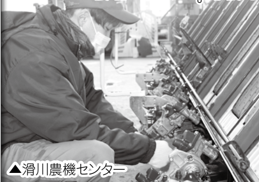
▲滑川農機センター

●JAアルプス立山農機センター 立山町前沢新町716 ☎462-19310 ●JAアルプス滑川農機センター 滑川市柳原79-5 ☎475-11261