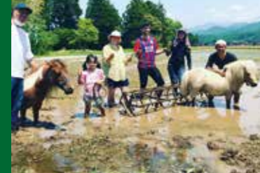
▲県内在住の外国人の方々も参加した田植え。(2021年5月15日撮影)