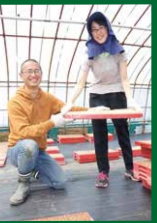
▲奥様も手伝ってハウスに苗を並べる作業。笑顔のご夫婦

また、農業以外にも自宅を改装して農村の暮らしが体験できる宿(民泊)を2018年に開業。県外から様々な人を受入れてきました。さらに、自分で築いた農村の内と外の双方のつながりを活かし、空き家となった農家住宅と都市部の就農希望者をつなぎ、支援しながら新たな農家を育てる試みをはじめられています。