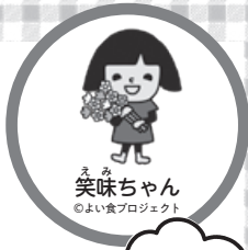
笑味ちゃん のよい食プロジェクト