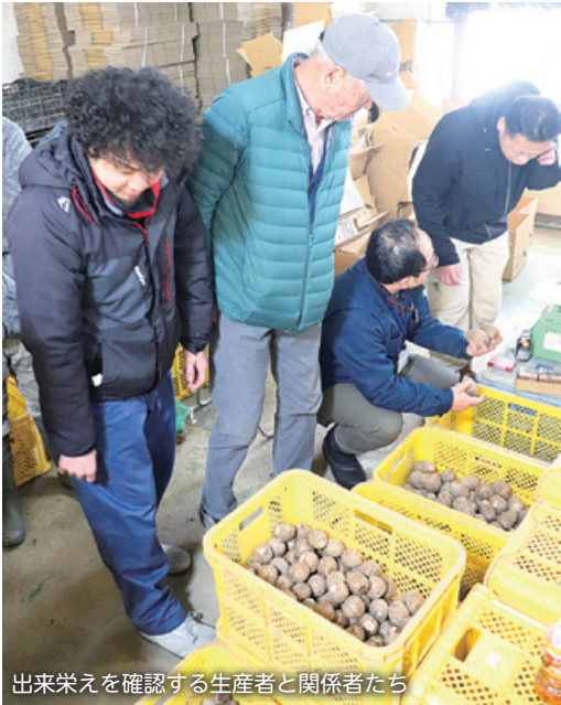
出来栄を確認する生産者と関係者たち

目揃い会には、同協議会のサトイモ生産者と市場関係者・富山県富山農林振興センター・JAアルプスなど約30名が参加し、令和6年産の出来栄を確認しました。