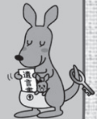
遺言書ほかんガール