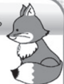
不動産登記推進イメージキャラクター「トウキツネ」