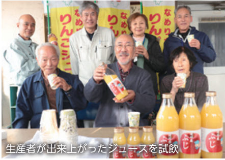
生産者が出来上がったジュースを試飲

滑川市りんご組合は12月20日、J Aアルプス浜加積倉庫事務所(滑川市中野島)で、同組合が生産するりんごを使用した滑川産「りんごジュース」の試飲会を開きました。