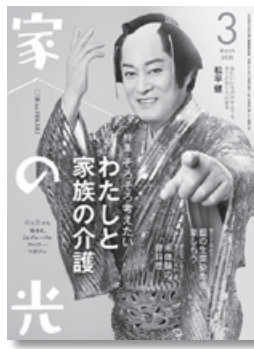
※表紙は変更になることがあります。

2025年3月号定価/629円(本体572円) お申し込みはJA(農協)へ 企画・タイトルは変更することがあります。