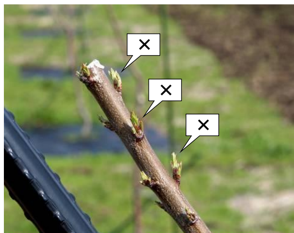
写真1 主枝先端部分の新芽の管理 (枝の背面(×印)の芽をかき取る)