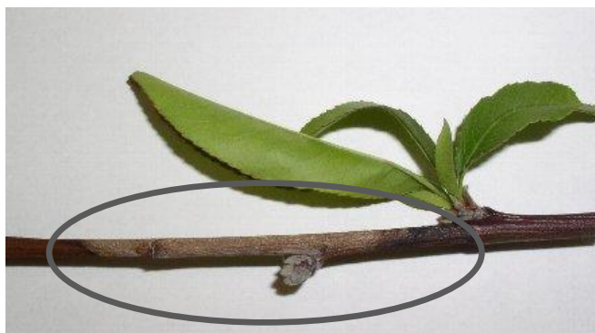
写真3 せん孔細菌病の春型病斑 (紫褐色～紫黒色の病斑)