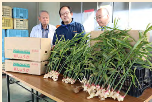
▲出来栄を確認する関係者たち