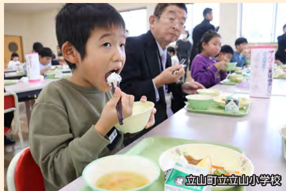
立山町立立山小学校

児童代表から「甘みが強くふっくらしていて美味しかったです。『富富富』についてたくさん学べました。新米をありがとうございました」とお礼の言葉で給食会を締めくくりました。