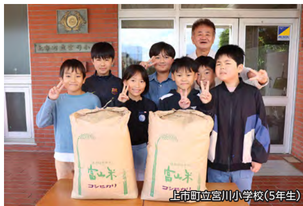
上市町立宮川小学校(5年生)