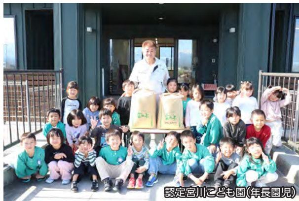
認定宮川こども園(年長園児)