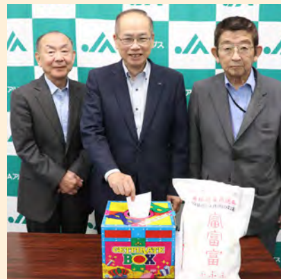
▲抽選を行うJAアルプス役員