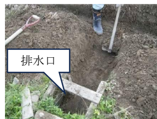
図3 水尻との連結と掘り下げ