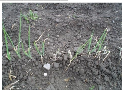
図2 霜害を受けたねぎ