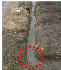
図5 額縁排水溝の連結部を しっかりつなぐ