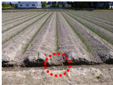
図4 植え溝を額縁排水溝へ しっかりつなぐ