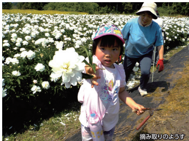
摘み取りのようす

同組合は今後も同町と協力し、栽培技術の向上と生産拡大を目指し取り組んでいくとしました。