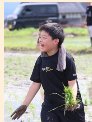
▲泥だらけになりながら田植えを楽しむ児童たち