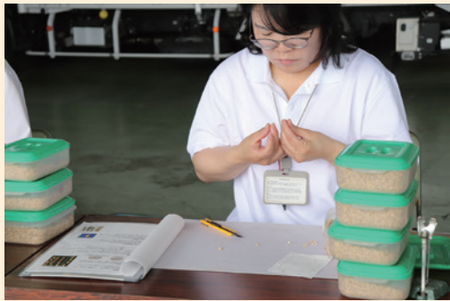
▲▼JAアルプス農産物検査員による初検査の様子