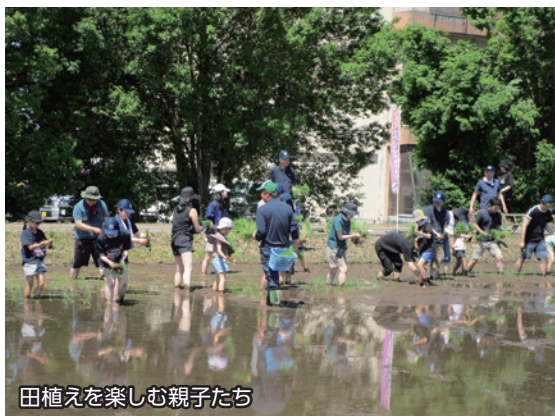
田植えを楽しむ親子たち