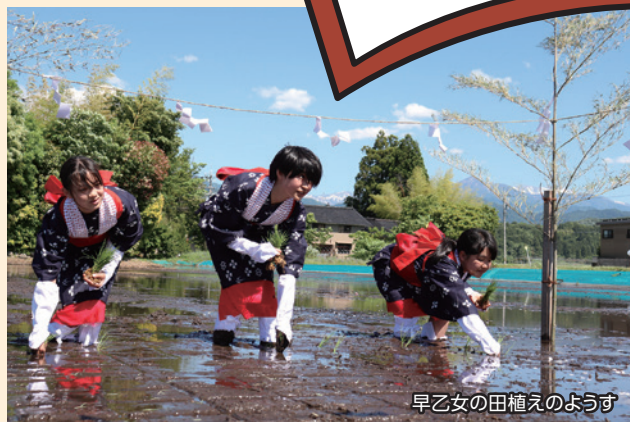
早乙女の田植えの様子