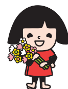
◎よい食プロジェクト