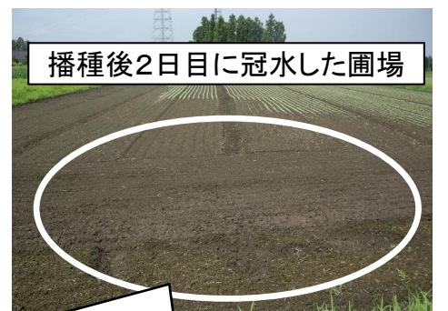
播種後2日目に冠水した圃場 冠水した部分が出芽不良となっている。